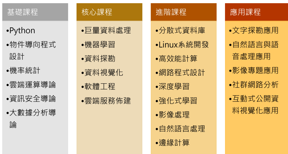
圖 8. 大數據與雲原生領域知識地圖

Linux系統開發、高效能計算、網路程式設計等等雲原生與微服務建置基礎。而機器學習課程可進階接續深度學習與強化式學習。機器學習與資料視覺化技能則搭配適當專題應用諸如文字探勘應用、自然語言處理、影像專題、社群網路分析、互動式公開資料視覺化應用等等進行能力與培養。