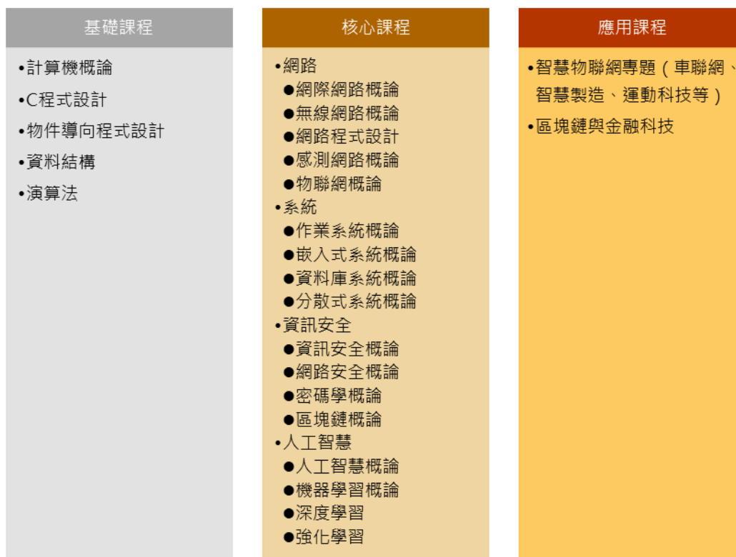
圖 7. 物聯網與區塊鏈領域知識地圖

應用課程方面則著重在物聯網與區塊鏈在各領域的應用。在物聯網方面，可以選定一個場域（如車聯網、智慧製造、運動科學等），介紹該領域的特性，並設計數個實作題目，讓學生可以透過實作更深入了解物聯網技術於實際場域的應用。在區塊鏈方面，可以介紹區塊鏈於金融科技的各項應用，例如目前熱門的DeFi、GameFi等，也可以介紹區塊鏈與物聯網系統在智慧製造環境（如生產履歷與物流）上的應用以及目前的發展趨勢。