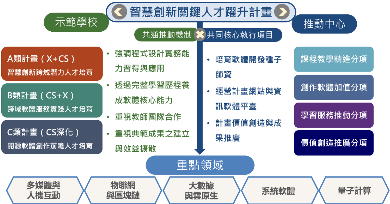
圖 1. 智慧創新關鍵人才躍升計畫推動架構