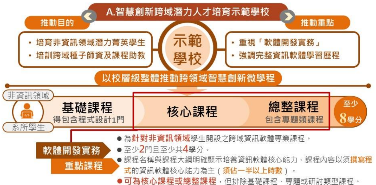
圖 3. 智慧創新跨域潛力人才培育示範學校