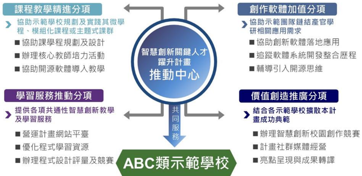
圖 2. 推動中心各分項推動工作

推動中心除總計畫辦公室外，包括課程教學精進、創作軟體加值、學習服務推動、價值創造推廣等四個分項，共同服務 A/B/C 三類計畫，其架構如圖 2 所示，各分項負責推動之工作分述如下。